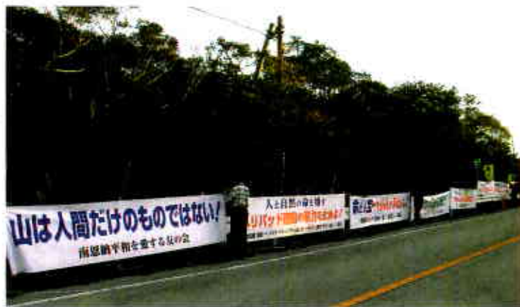
国道58号沿いに並ぶ横断幕

ジャングル戦闘訓練センター（以下、北部訓練場）は、“やんばる”の自然豊かな国頭村と東村にまたがる総面積約78.3 km 2 、沖縄県最大の軍事演習場。SACO合意により、殆ど使われていない北半分の返還と引き換えに、米軍のヘリパッド6箇所（北部訓練場には既設2箇所）を同訓練場に隣接する東村高江区を囲むように新設する工事が強行されている。15年も前のSACO合意に何ら検証が加えられないまま強行されるヘリパッド工事・オスプレイ配備に反対し、国に説明と話し合いを求めて高江区住民は工事現場の入口で、座り込み、説得・監視行動を続けている。